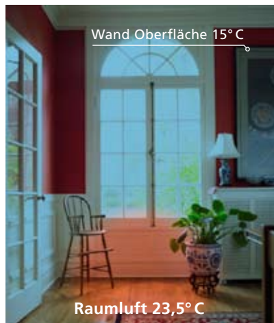
Vor der Innendämmung: Kalte Wände – unbehaglich trotz hoher Raumtemperatur.

STEICO therm internal lässt sich in Innenräumen direkt verkleben und verputzen, so dass eine fast unbegrenzte Vielzahl an Farb- und Gestaltungsmöglichkeiten erreicht werden kann. Und damit die positiven Eigenschaften der Holzfaser-Dämmung auch durch das Putzsystem voll unterstützt werden, hat STEICO zusammen mit renommierten Partnern detaillierte Aufbauempfehlungen erarbeitet. Die gesamten Systemlösungen finden Sie unter www.steico.com .