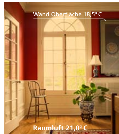
Nach der Innendämmung: Warme Wände schaffen Behaglichkeit schon bei geringerer Raumtemperatur.

Die Innendämmung mit STEICO therm internal erhöht die raumseitige Oberflächentemperatur der Wand – ein weiterer wichtiger Schutz gegen die Bildung von Schimmelpilzen. Ganz nebenbei fühlen wir uns in Räumen mit warmen Wänden deutlich wohler. Und weil die gefühlte Temperatur steigt, kann die tatsächliche Raumtemperatur oft sogar leicht gesenkt werden.